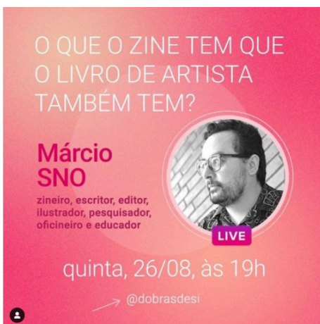
Figs. 3 e 4: divulgação de “lives” com participação de Sno.

Atualmente, o canal Meu Zine Minha Vida se encontra no 16º episódio (realizado em 22/12/2020), com o tema “Zines LGBTQIA+, conforme se vê na imagem que se segue: