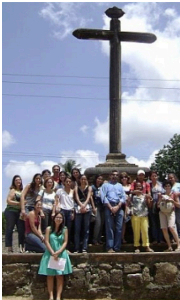
Figura 02: Momentos de lazer e aprendizado em Igarassu/PE (abaixo e na página seguinte)

as obras pictóricas seculares, as quais expressaram a cultura e o cotidiano do homem barroco.