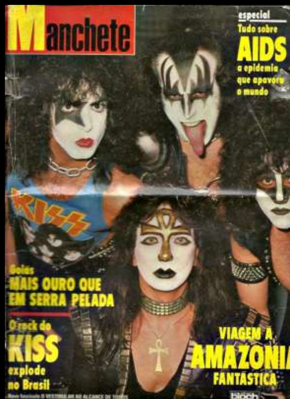
Revista Manchete 1983