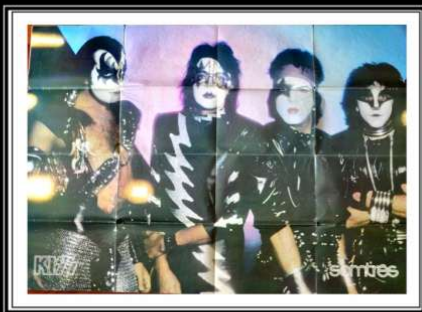
Revista Somtrês década de 80