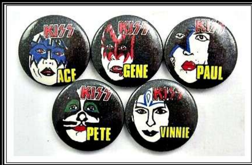
BUTTONS , BADGES AND PINS