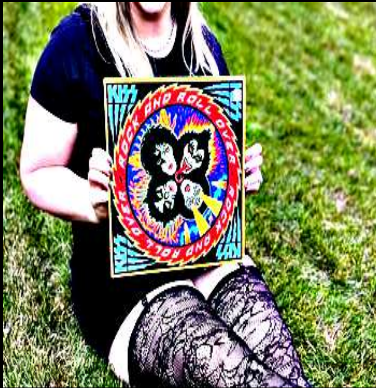
ARCHIVE KISS VINYL