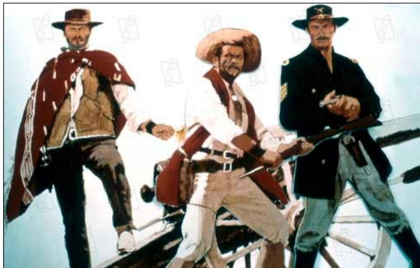
O trio principal de O Bom, o Mau e o Feio

1984, pouco antes da morte de Sergio Leone, hoje, em uma época em que o spaghetti western passa por uma revisão em vários países europeus e até na América, o nome mais festejado do gênero. Ele merece, sem dúvida alguma. Mas Leone não foi o único a produzir clássicos. Outros diretores italianos chegam bem perto.