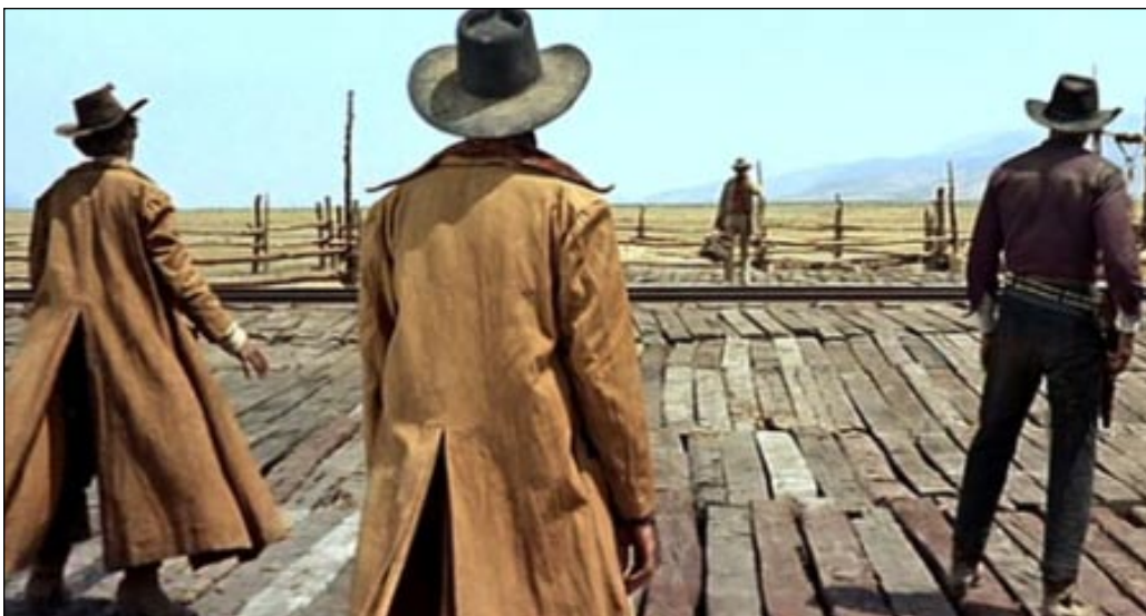
Pistoleiros se enfrentam na abertura de Era Uma Vez... no Oeste , clássico de Sergio Leone

a quem Leone queria em Por um Punhado de Dólares mas não conseguiu, na ocasião (para sorte de Eastwood). Assim, com Eli Wallach, que vivia o bandido Calvero naquela produção, roubando a cena em O Bom, o Mau e o Feio e Charles Bronson, ou-