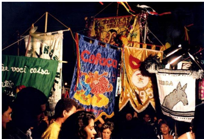
Encontro de estandartes na abertura da Folia de Rua

Temos, sem dúvida, uma semana pré-carnavalesca de tirar o fôlego, que começa com a abertura da Folia de Rua, na sexta-feira precedente e vai até o sábado de carnaval com o rufar dos últimos blocos e o entusiasmo dos foliões do Cafuçu varando a madrugada.