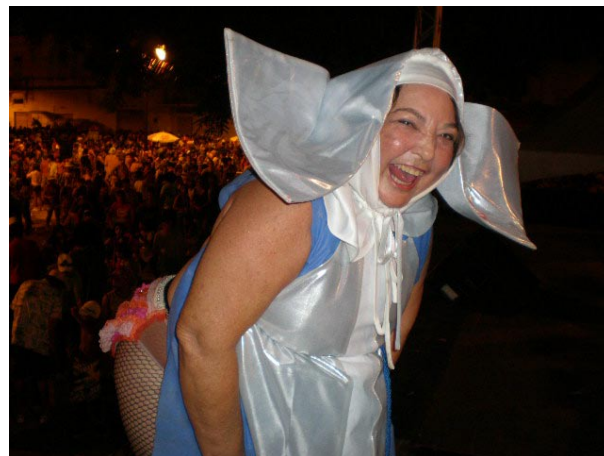
A irreverente Corrinha não poupa a religião. Cafuçú, carnaval de 2010

O carnaval, pela magnitude, diversidade expres-