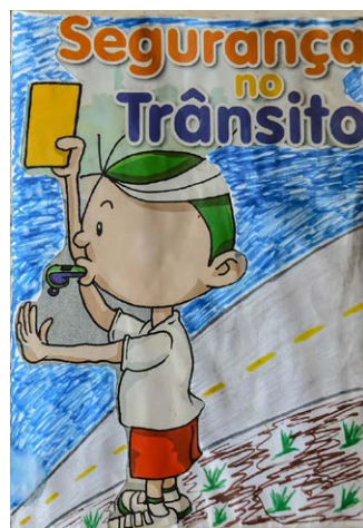
Capas de fanzines produzidos nas oficinas