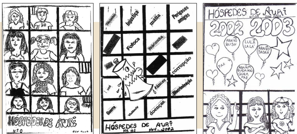
Capas do fanzine Hóspedes de Auri

Solicitei autorização à direção. Ficou acertado que teríamos um encontro quinzenal com, no máximo, oito pessoas, e sob vigilância de uma agente prisional. E, ainda, que o material era por minha conta e proibido uso de revista e tesoura. Assim passamos a confeccionar o fanzine Hóspedes de Auri 16 . Conseguimos um patrocinador para fazer xerox. Em pouco tempo os professores passaram a valorizar o material escrito e utilizavam em sala de aula. A frequência à escola melhorou consideravelmente. Os encontros para confeccionar os zines passaram a ser disputados até por pessoas que não sabiam ler nem escrever. Elas queriam ver suas histórias, seus recados no fanzine e pediam para as colegas escreverem.