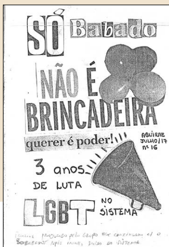
Edições 1 e 16 do fanzine Só Babado