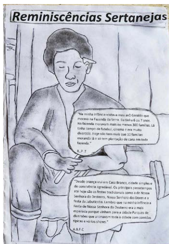
Expressão poética nos fanzines